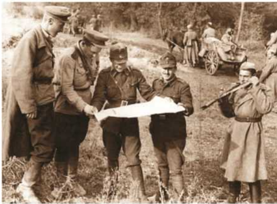
Ofițeri romani studind harta înaintea unei noi acțiuni militare în Transilvania (octombrie 1944).

Moment simbolic în istoria poporului român, înscris în calendarul sărbătorilor noastre de suflet, ziua de 25 Octombrie este Ziua Armatei Române, o zi de glorie și de cinstire pentru eroismul și jertfele prin care, de-a lungul vremii oștirea noastră și-a îngemănat faptele de arme cu soarta neamului românesc, îndeplinindu-și misiunea nobilă de a